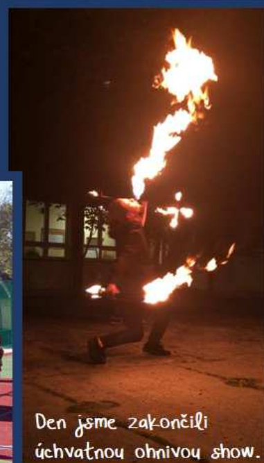
Den jsme zakončili úchvatnou ohnivou show.